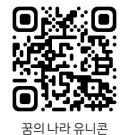
꿈의 나라 유니콘