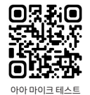
아아 마이크 테스트