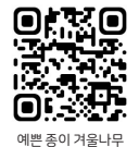
예쁜 종이 겨울나무