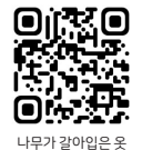
나무가 갈아입은 옷